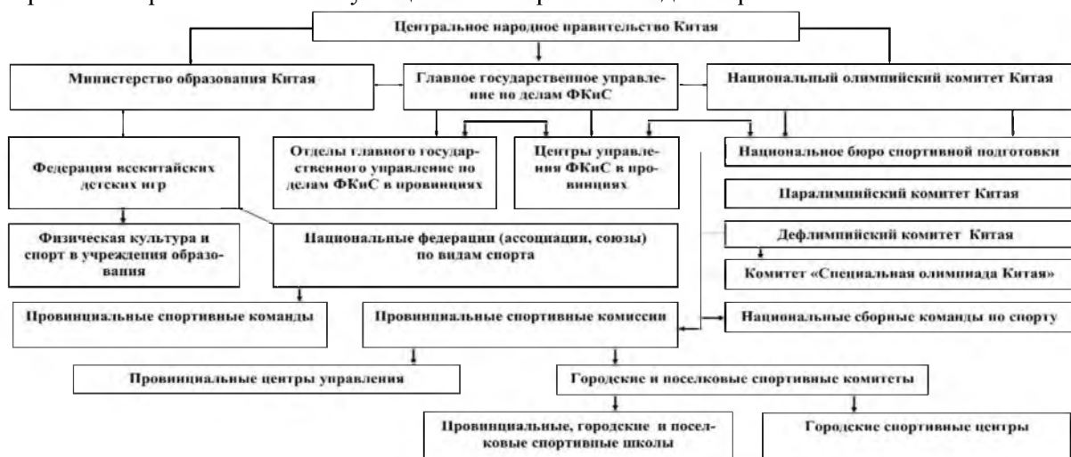
Рисунок 2 – Организационно-институциональная модель управления физической культурой и спортом в Китае (Составлено автором на основе [21, 25-30])

Спортивные интернаты, в КНР выступают в роли первого звена подготовки будущих спортсменов-профессионалов. Молодые спортсмены проводят здесь круглые сутки. Первая половина дня здесь посвящена изучению общеобразовательным предмета, а вторая – совершенствованию учащихся в избранном виде спорта.